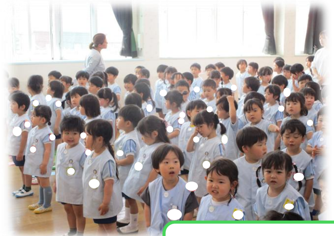
ごとう幼稚園の歌