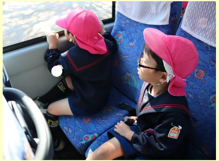
年長さんはジャングルバスで動物たちに餌をあげました♪