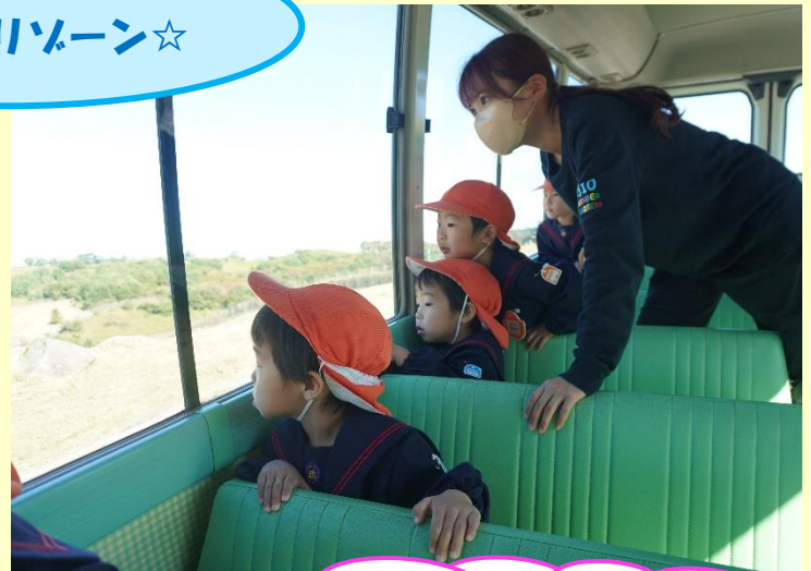
動物さん大きいなあ…