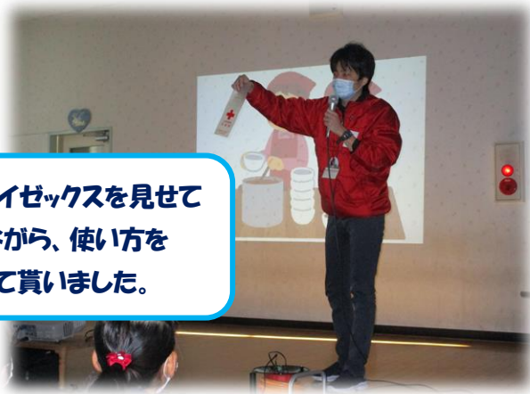
実際にハイゼックスを見せて頂きながら、使い方を教えて貰いました。

子どもたちはこの活動で、自分たちが暮らしている環境が恵まれている事に気付いたり、今流行している新型コロナウイルスの感染予防対策について再確認したり、世界にはいろいろな困りを持った人がいる事を知れたり、いろいろな事を考える事が出来ました。今後も、周りの人へ優しい気持ちを持ち、助け合いの心を持った優しい子どもたちに育ててほしいと思います。